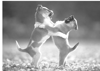
Deux chiots se menacent dans un jeu de lutte

Elle se traduit chez le chien par un ensemble de postures corporelles (par exemple, le regard fixé vers l'individu visé), de mimiques faciales (par exemple, les babines retroussées laissant apparaître les canines) et de vocalises (par exemple, les grondements ou les aboiements). Elle est destinée à éloigner ce que le chien perçoit comme étant un danger. Seule une menace inefficace aboutit à la morsure. C'est pour cette raison qu'il est important de considérer que la menace a d'abord pour fonction d'éviter la morsure.